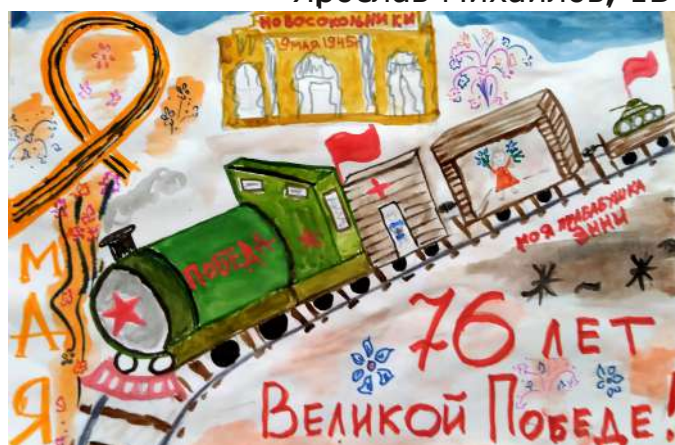
"Домой", Хххххх Хххххххх, ХХ