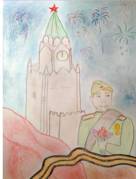
Рисунок: Георгий Сантус, 56

Художественные экспозиции развернулись на первом и втором этажах нашей школы. Несколько работ украсили также и праздничный выпуск "Школы на Волхонке". Спасибо всем участникам акции!