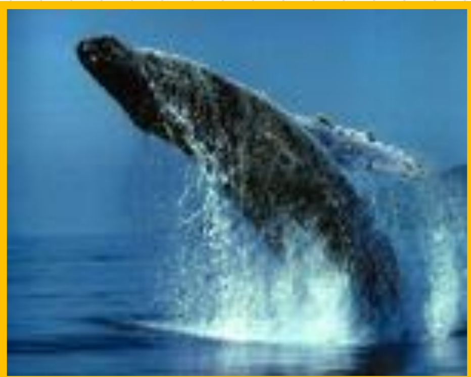
самка синего кита